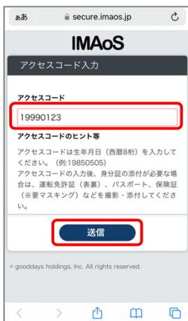
② 指定のアクセスコードを入力します。