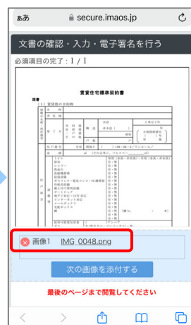
④ カメラ機能で身分証（※）を撮影します。