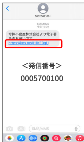
① 署名依頼のショートメールのリンクを押します。