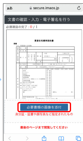
③ 契約書を最後まで閲覧し、「必要書類の画像を添付」を押します。