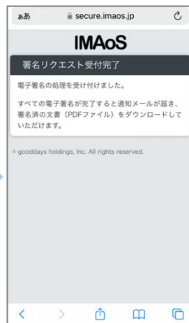
⑦ 以上で電子署名の操作が完了です。すべて署名が完了すると通知が届きます。