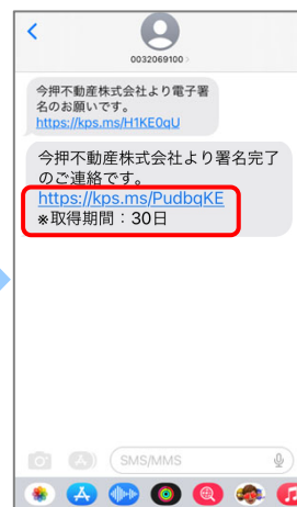
⑧ 通知メールが届きましたら、URLを押します。 (有効期限30日)