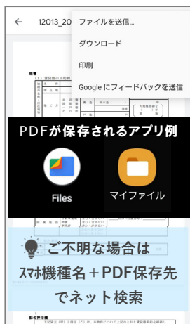
⑩ 契約書は「Files」や「マイファイル (Galaxy)」などに保存されます。