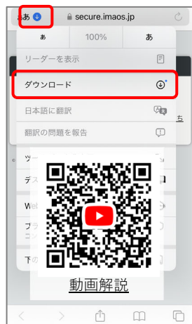
⑨ iPhoneはアドレスバーの青い矢印を押し、「ダウンロード」を選択します。