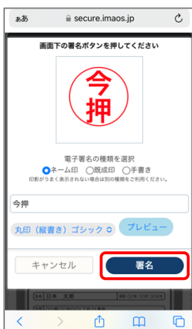
⑥ 印影が表示されますので「署名」を押します。