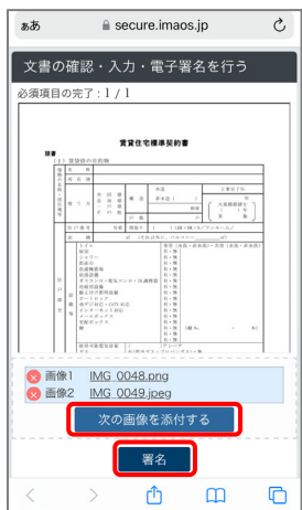
⑤ 裏面を撮影する際は、「次の画像を添付」を押して「署名」を押します。